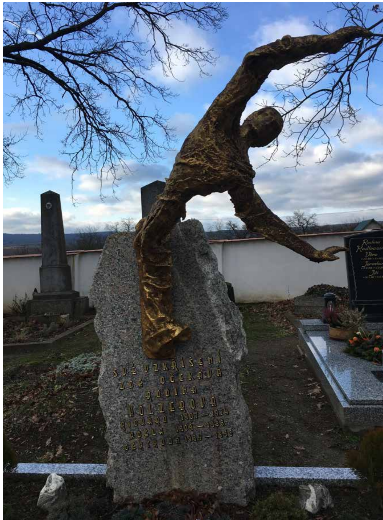
Hřbitov v Šatově

že jeden z nich, až nastane čas odchodu toho druhého spojený se smutkem, se nebude muset zabývat sháněním místa posledního odpočinku. A tuto cestu bych rád poradil každému z nás: Smrt si pro nás jistojistě přijde, mějte před ní náskok a všechny záležitosti s ní spojené, které máte možnost ovlivnit, si zaříd'te, dokud je čas. Tátu jsem ihned po jeho skonu zaopatřil v kruhu rodinném, ruku k dílu přiložila máma a sourozenci. Tělo jsme sami umyli, oblékli a uložili do rakve zakoupené přímo u výrobce. Hrob, a jak se hodil, jsme mu s kamarádem vykopali vlastníma rukama.