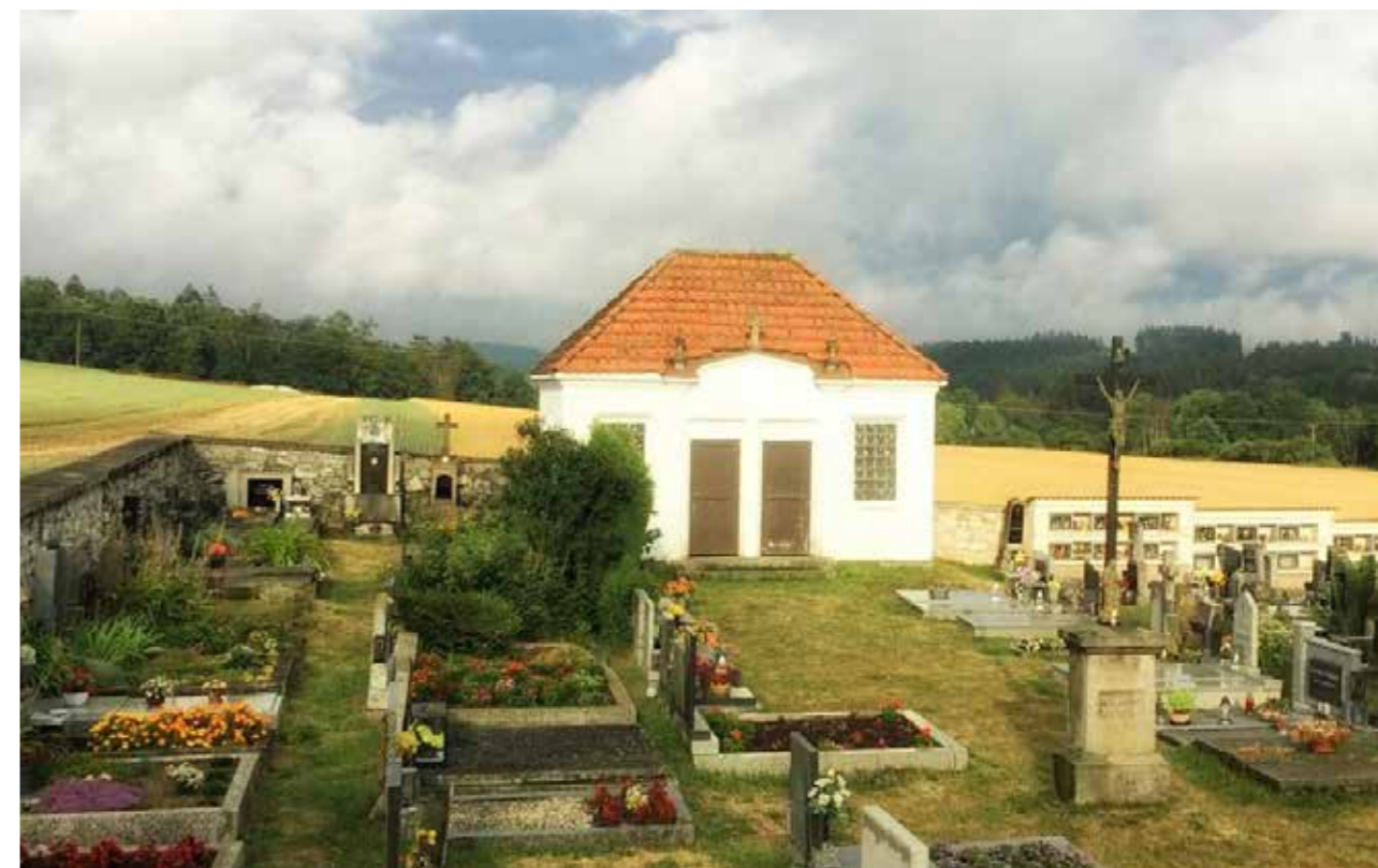
Mármice v Soběšíně

Projekt bude postaven na silných příbězích pochovaných osobností, z nichž za nejvýznamnější lze považovat malířku Pauline Bäuml. V rámci vzpomínkových tras pojících se k této osobnosti povedou po městě různé odnože do míst, kde žila, a to i formou komentovaných prohlídek.