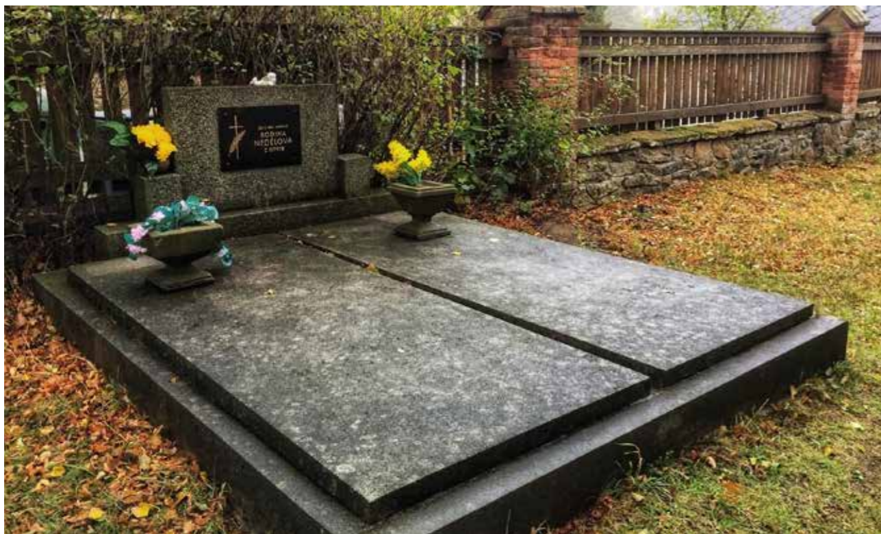
Hrobové místo zřízené mimo pohřebiště v Soběšíně u kostela sv. Havla

Jak mně to čas dovolí, ihned odjíždím z Prahy na chalupu do Soběšína, malebné středočeské obce nad řekou Sázavou obklopenou soukromými lesy pánů Šternberků. A tam... zpravidla jdu se psem podél místní říčky na hřbitov. Máme je tam hned tři. A všechny, co do majetku, církevní. Mám rád jejich atmosféru, malebnost toho jediného dosud nezrušeného se 129 hroby, navíc vedu tamní hřbitovní knihu. Sekám na jednom z nich trávu, hrabu ji osušenou na kupy a odvážím jalovicím do místního kravína. Občas mi pomůže někdo z rodiny, občas někdo od sousedů. Ministruji v prázdném kostele, zpívám žalmy, zvoním umíráček, střídám se se ženou ve šlapání měchů na varhanách. Do kostela sice nikdo, kromě mé mladé paní, dětí a varhanice, pravidelně nechodí, panu faráři to ale nevadí.