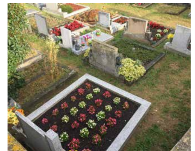
Ze hřbitova v Soběšíně

Jaký máte názor na pohřby bez obřadu, by byla zbytečná otázka. Během doby pandemie se tento trend ještě více prohloubil. V Praze je údajně dokonce více než polovina pohřbů bez obřadu. Domníváte se, že by tento trend mohla odvrátit např. forma sociální dávky pro osoby v hmotné nouzi, které potřebují pohřbit příbuzného?